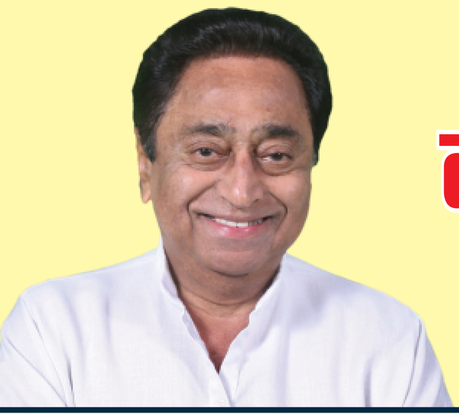
कमल नाथ मुख्यमंत्री, मध्यप्रदेश